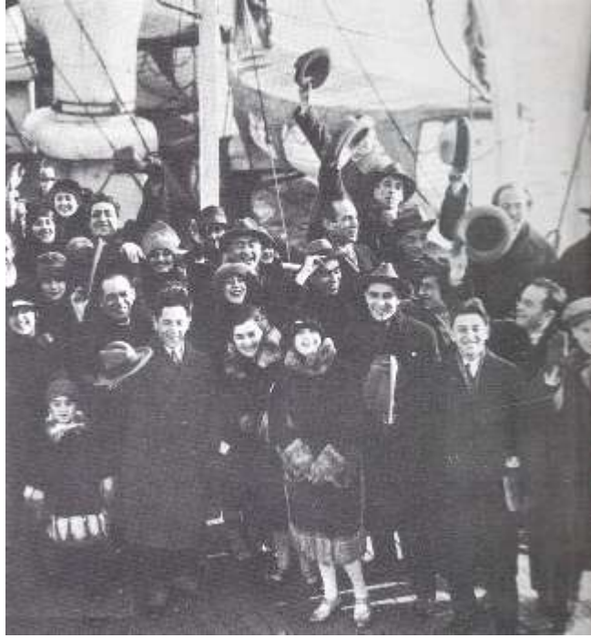
שחקני תיאטרון "הבימה" מגיעים לנמל ניו יורק, (1926)

גם בתוך הלהקה היה אי שקט. נחום צמח, המייסד, ביקש להיות מנהל ופוסק יחיד. השחקנים מרדו בו, התעוררו מריבות קשות ובחודש יוני 1927, התפלגה הלהקה. רוב השחקנים החליטו לעלות לארץ ישראל. נחום צמח וקבוצת שחקנים נשארו בארצות הברית. צמח ניסה להקים שם תיאטרון עברי אבל ללא הצלחה. בשנת 1935 ניסה לחזור ולהיקלט ב"הבימה", אך ללא הצלחה. הוא חזר לאמריקה ומת שם בודד וחסר כל בשנת 1939.