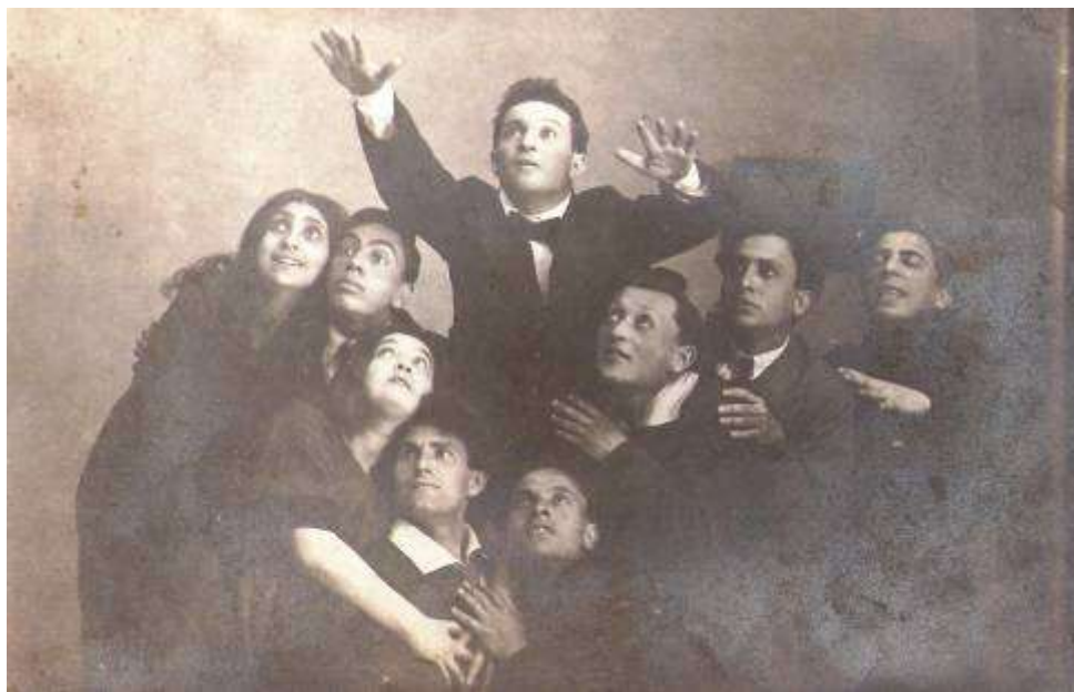
שחקני תיאטרון הבימה (1922)