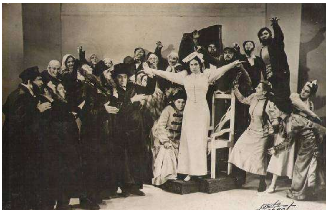
שחקני תיאטרון "הבימה" באולפני הטלוויזיה של ה-BBC. (1938)

ב-1938, הופיע התיאטרון באנגליה ו"הדיבוק" היה המחזה הראשון שהוצג אי פעם בטלוויזיה באחד הנסיונות הראשונים שערך ה-BBC.