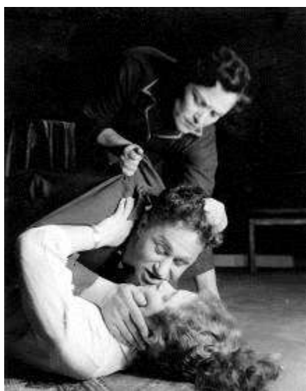
"מראה מעל הגשר" (1956)