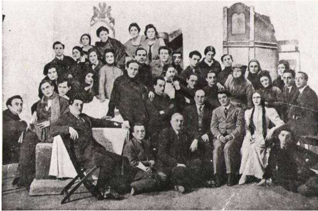
משתתפי הצגת "הדיבוק" (1923)

ארבעה חודשים לאחר הצגת הבכורה מת וכטאנגוב.