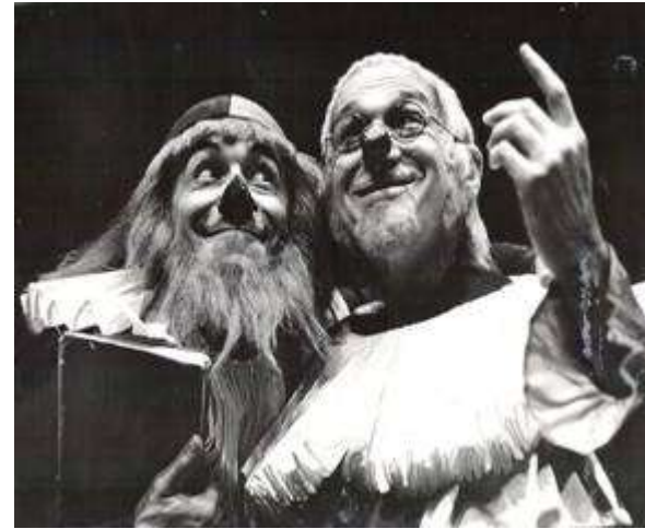
"על קלות דעת וצביעות" (1974)