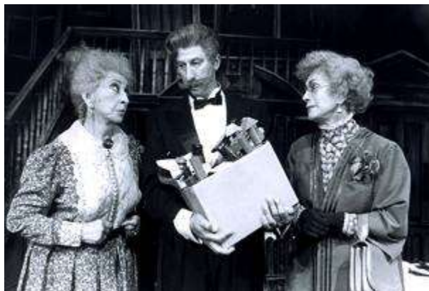
"רעל ותחרה" (1991)