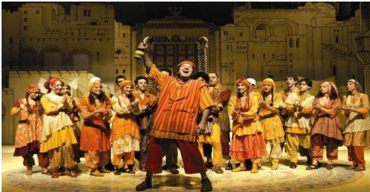
"שלמה המלך ושלמי הסנדלר" (2005)