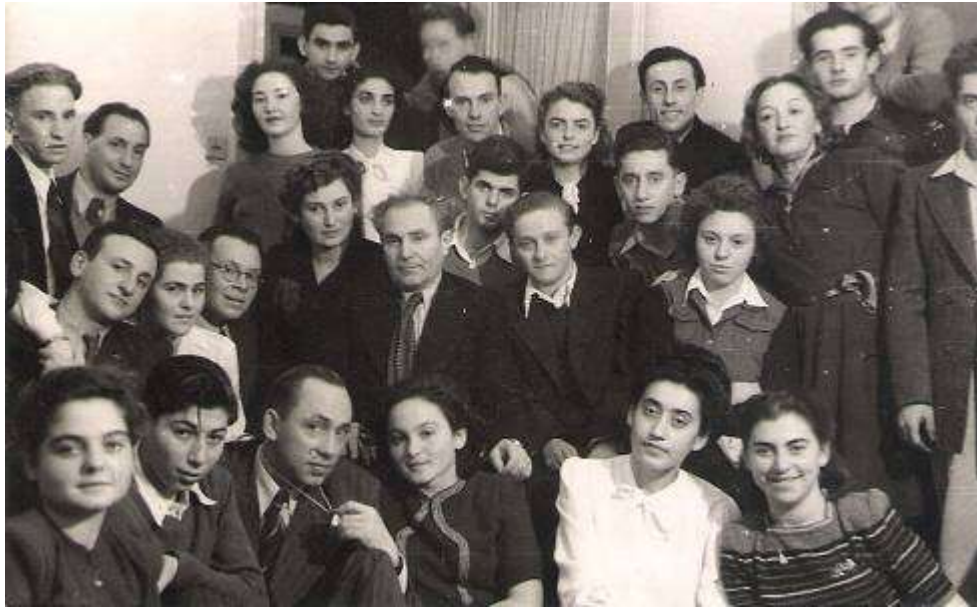
תלמידי המחזור הראשון של בית הספר הדרמטי של תיאטרון "הבימה". (1947)

בשנה זו נכנס התיאטרון לביתו החדש . בראשית 1947, לאחר יותר מעשר שנים, הגיע ל"הבימה" במאי מחוץ לארץ – טיירון גאטרי האנגלי. הוא ביים את "אדיפוס המלך" מאת סופוקלס. בהצגה השתתפו כל שחקני התיאטרון. הביקורת קבלה את ההצגה בהתלהבות. זו הייתה אחת מהצגות השיא של "הבימה".