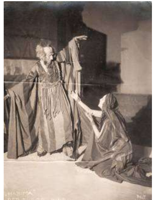
"היהודי הנצחי" (1919)

"הבימה" הוכרה כתיאטרון ממלכתי של המדינה הקומוניסטית והוקצב לה מענק שנתי. אולם אנשי ה"יבסקציה", ארגונם של הקומוניסטים היהודיים, שנאבקו בציונות ובעברית, טענו לפני השלטונות כי "הבימה" הוא תיאטרון "בורגני וריאקציוני המשחק בשפה שאבד עליה הכלח" והצליחו לבטל את ההכרה בו. צמח פנה לוועד המרכזי של המפלגה הקומוניסטית וטען כי אין סתירה בין תיאטרון עברי ובין המהפכה הרוסית.