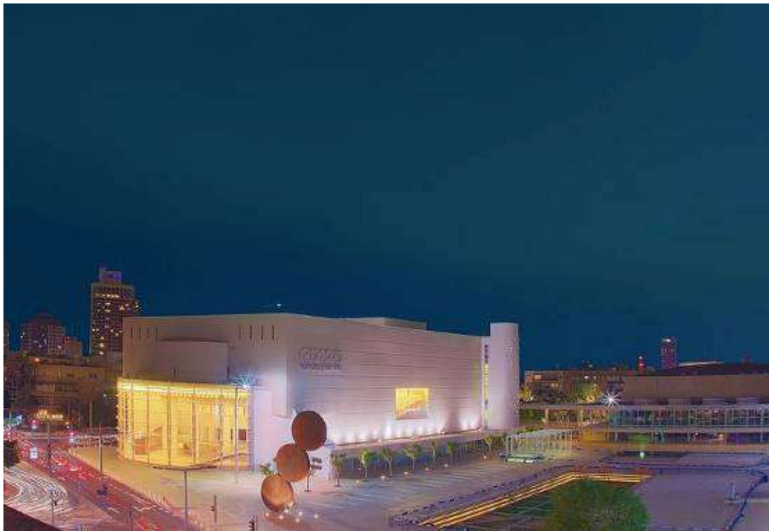
משכן תיאטרון "הבימה" המחודש (2011)

ב- 15/11/2011 חזר התיאטרון למשכן הקבע שלו – בניין "הבימה" המשופץ.