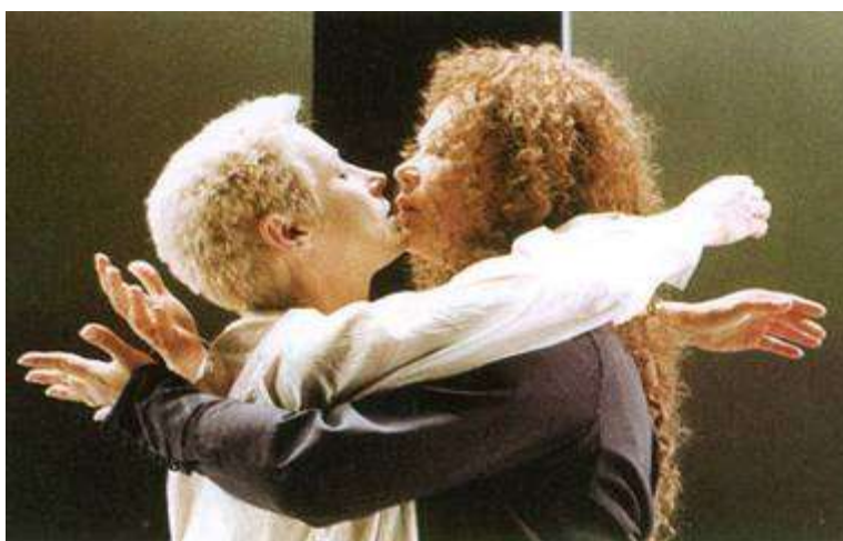
"הילד חולם" (1993)