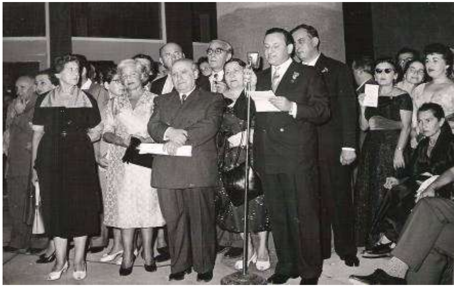
חגיגות יובל ה – 40 לתיאטרון "הבימה". (1958)

בחגיגות יובל הארבעים, הוכרזה "הבימה" כתיאטרון לאומי. ההכרה הרשמית הביאה איתה סיוע ממשלתי קטן. באותה שנה, 1958, זכתה "הבימה" גם בפרס ישראל.