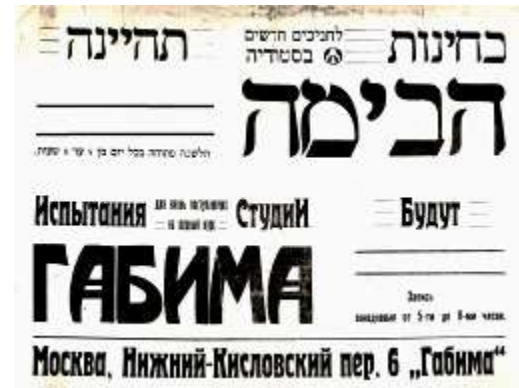
מודעת בחינות הכניסה ל"הבימה"