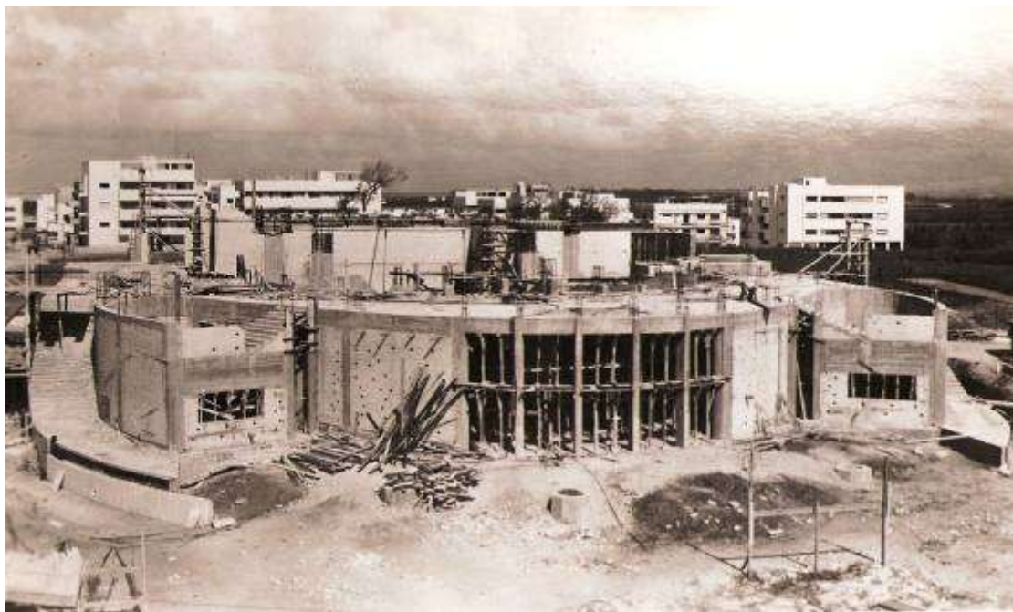
בניית משכן תיאטרון "הבימה", תחילת שנות הארבעים.

ב-1935, הונחה אבן הפינה לבניין "הבימה". את הבניין תכנן אוסקר קאופמן.