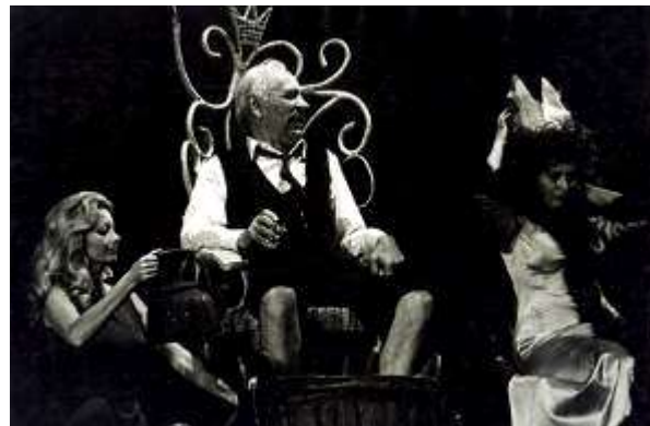
"הצוענים של יפו" (1971)