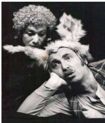
"חלום ליל קיץ" (1978)