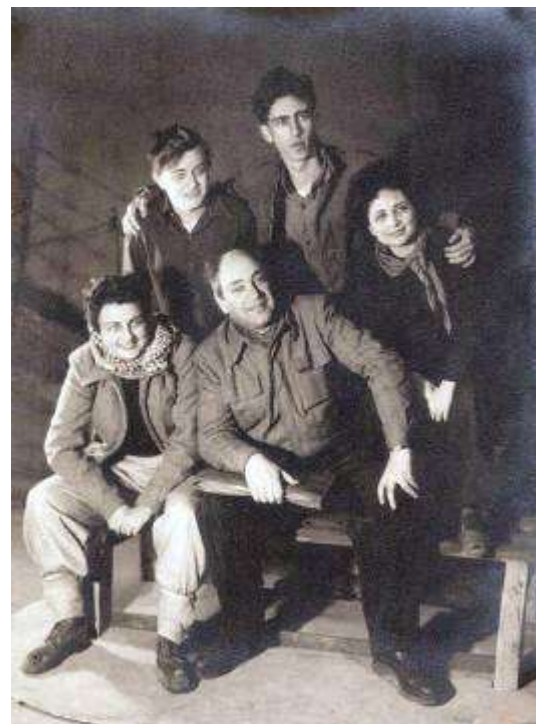
"בערבות הנגב" (1949)