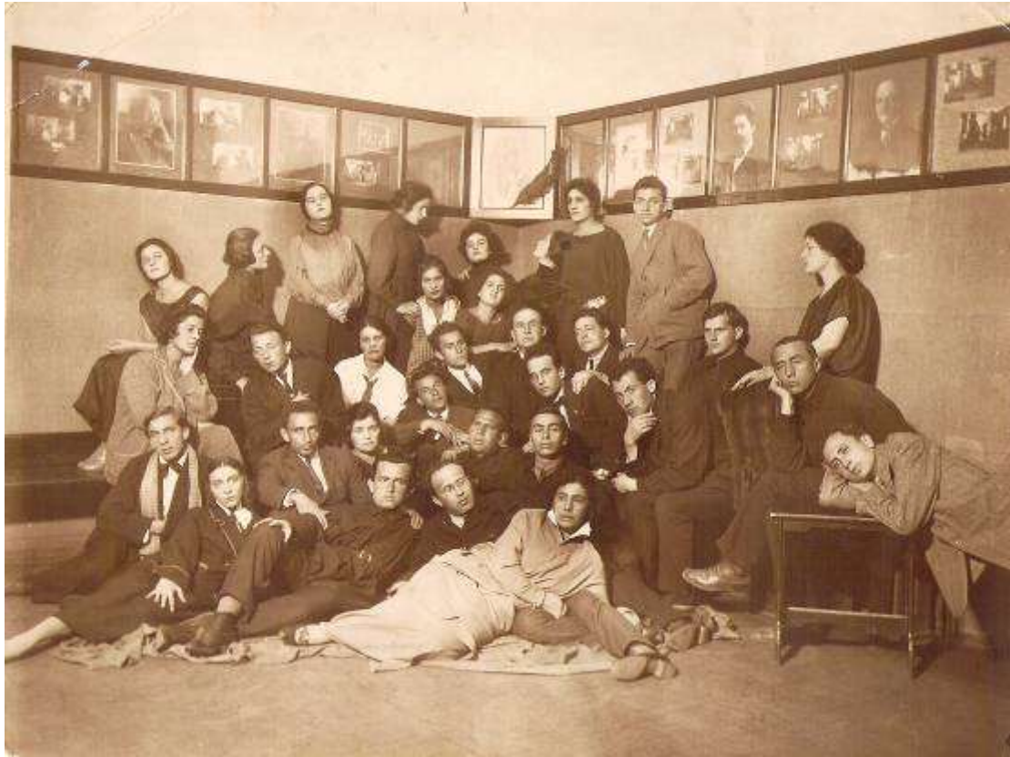
שחקני תיאטרון "הבימה" בפואיה התיאטרון ברחוב ניז'נה קיסלובסקה מס' 6, מוסקבה. (1924)

בינואר 1926, בברכת סטניסלבסקי, יצאה "הבימה" למסע הופעות באירופה ובאמריקה, עדיין כתיאטרון "ממלכת רוסי".